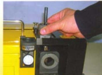
シンニング(2番落とし)